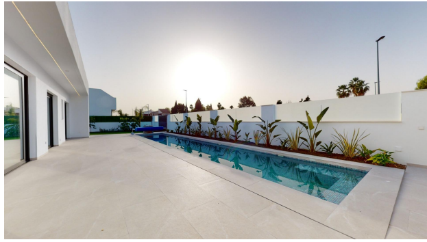
VILLA - 173m2 CORNER PLOT 509m2